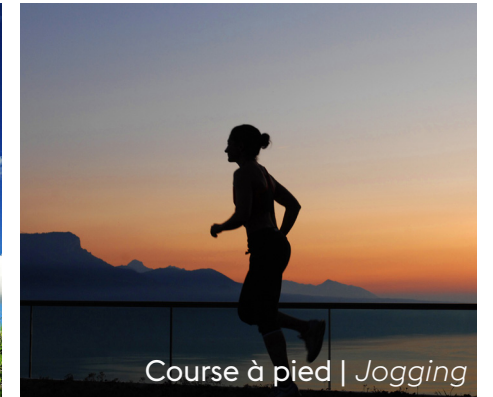
Course à pied | Jogging