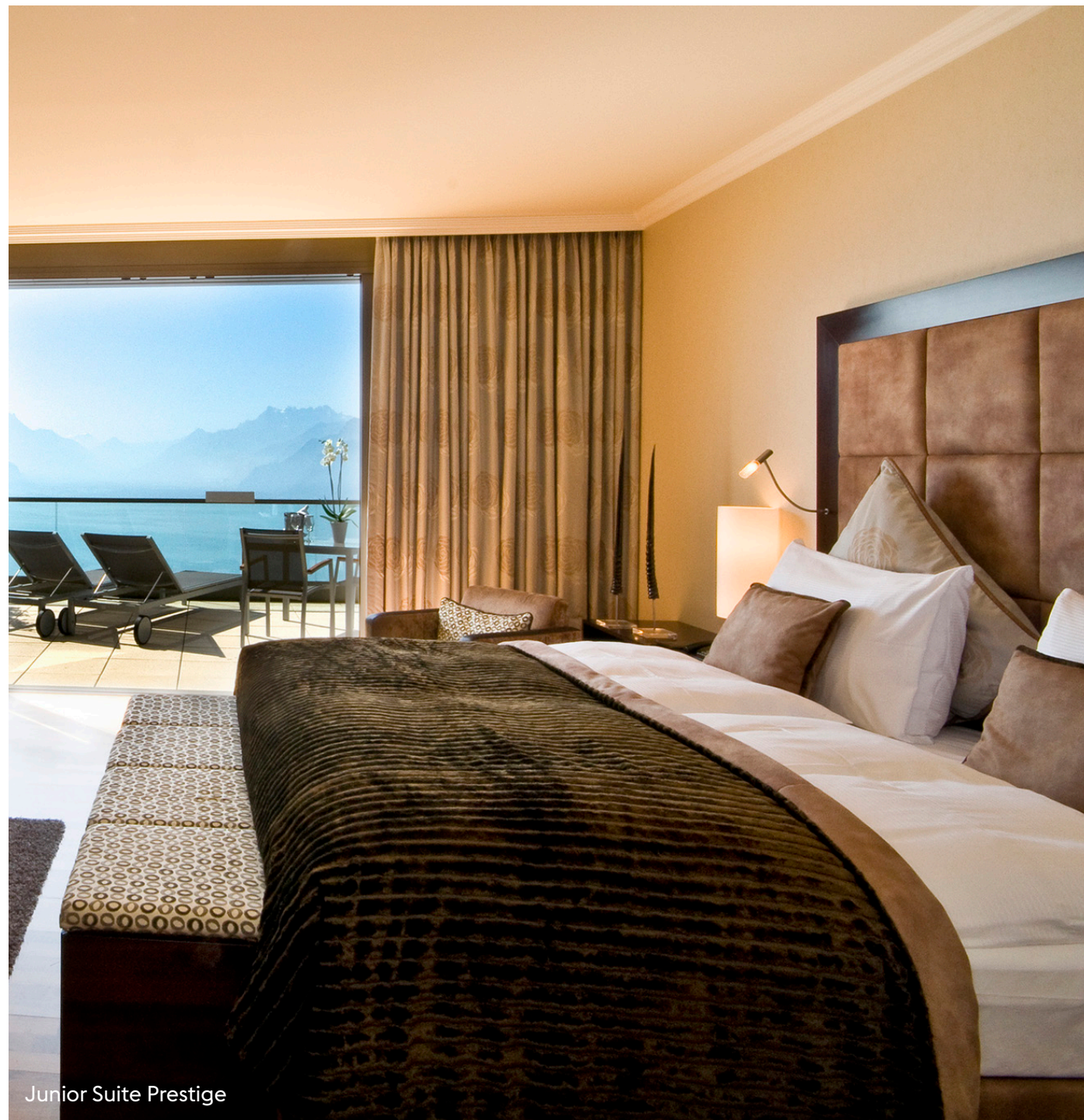
Junior Suite Prestige