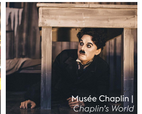
Musée Chaplin | Chaplin's World