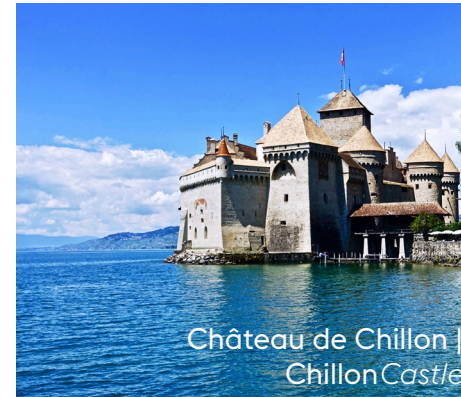
Château de Chillon | Chillon Castle