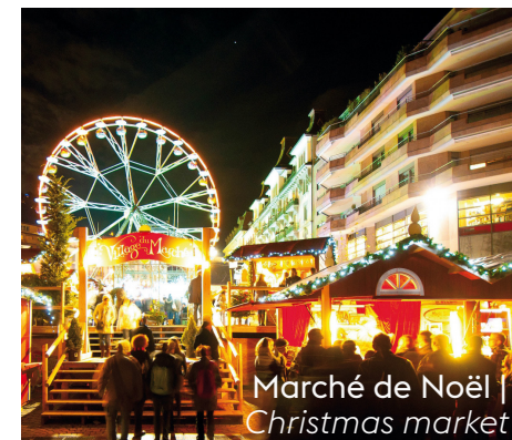
Marché de Noël | Christmas market