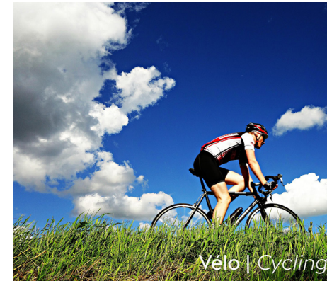
Vélo | Cycling