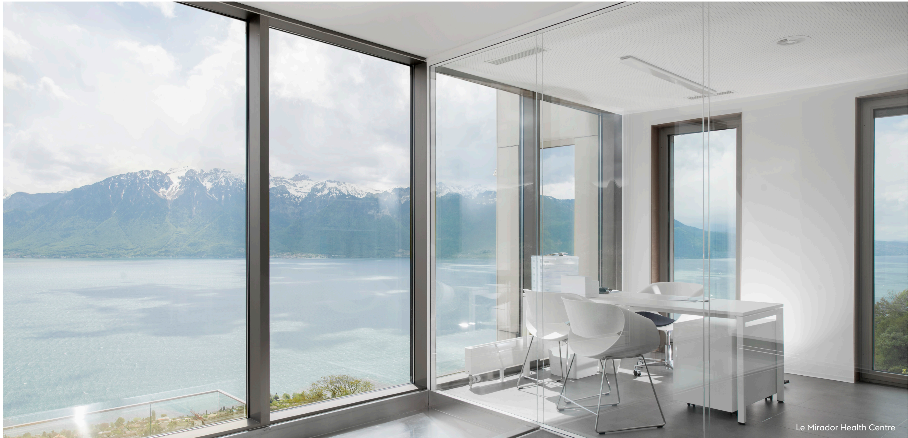
Le Mirador Health Centre