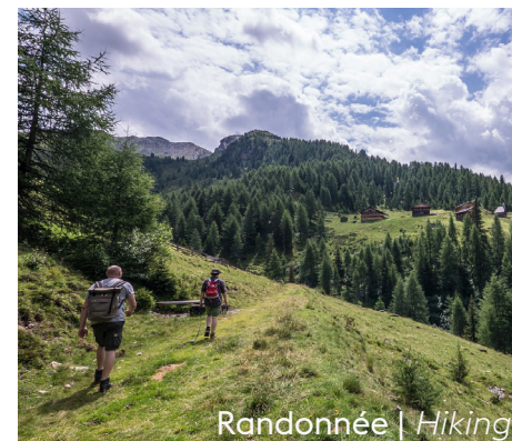
Randonnée | Hiking