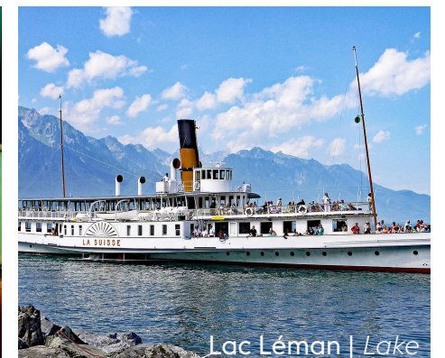
Lac Léman | Lake